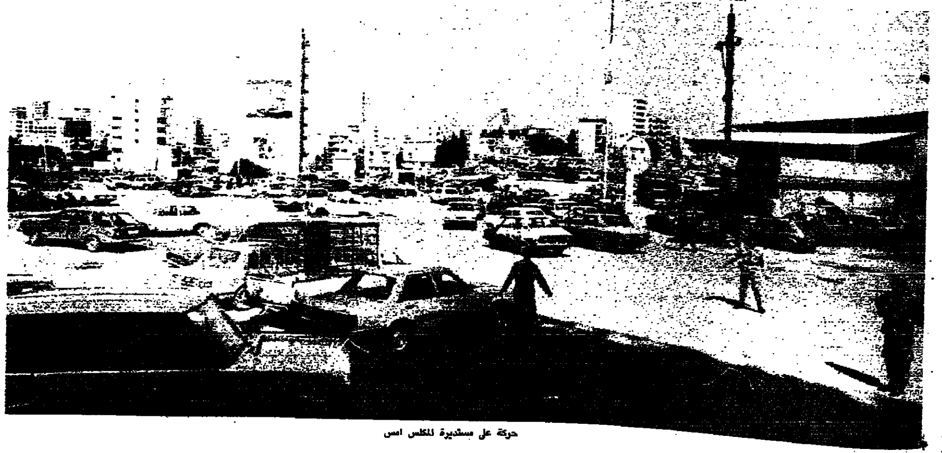
حركة على سكة حديدية للكبس اسس